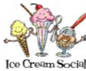
Ice Cream Social

¡Muchas cosas están sucediendo en Santos Apóstoles este verano y nos gustaría que estuvieras en TODO! Por favor, marca tus calendarios!